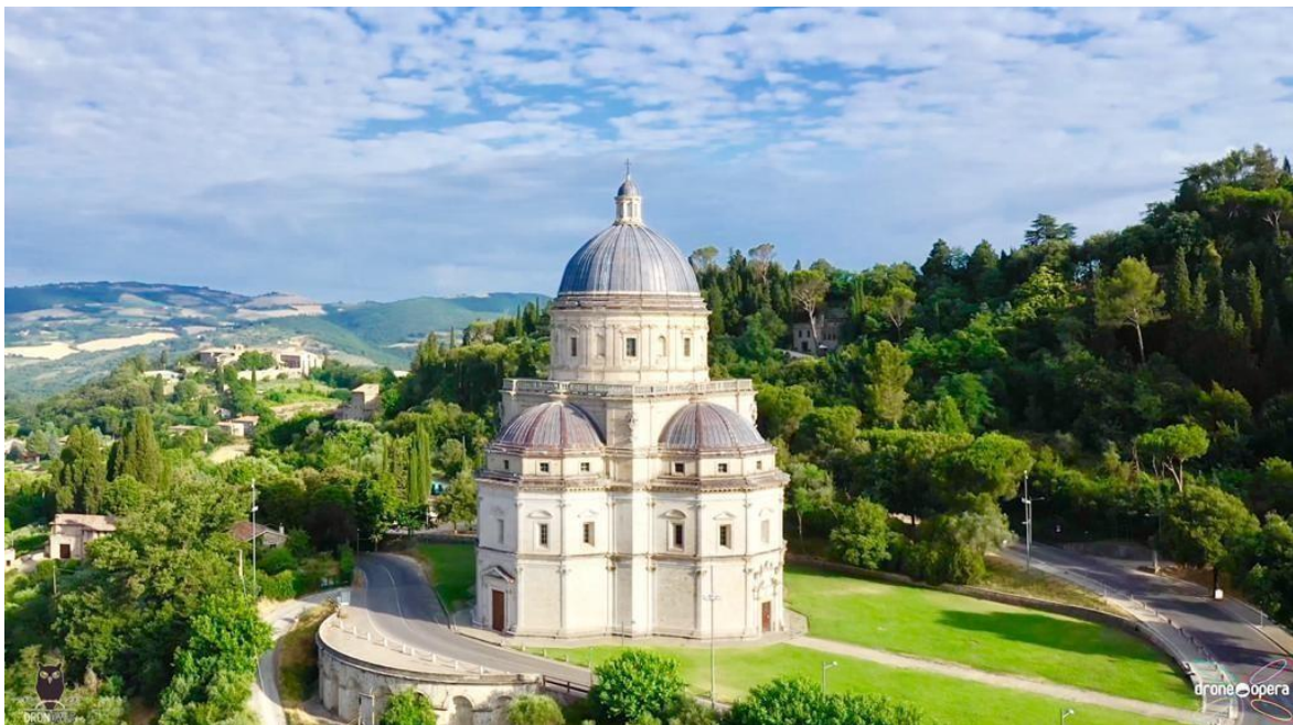
Tempio di Santa Maria della Consolazione, 1508

Verrà sempre utilizzata la data dell'11 febbraio, Giornata Mondiale del Malato, per l'inaugurazione di ogni installazione, per mantenere un legame con la prima installazione realizzata davanti al Tempio con il progetto "Consolazione" dell'artista Tommaso Franchi, 2019-2020. I partecipanti vivranno così, contemporaneamente, una duplice esperienza: quella storica, collegata al Tempio della Consolazione e alla memoria del luogo, e quella presente, legata all'attualità tramite la riflessione sul presente attraverso l'epifania della creazione artistica. I visitatori si troveranno così coinvolti in una riflessione sulla vita, la cura e la fragilità della nostra condizione umana e naturale.